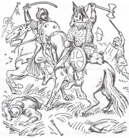
Charles Martel vainquit les Arabes à Poitiers en 732.